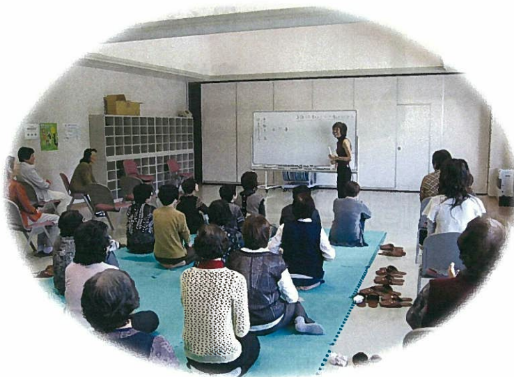
(母子寡婦福祉研修交流会)